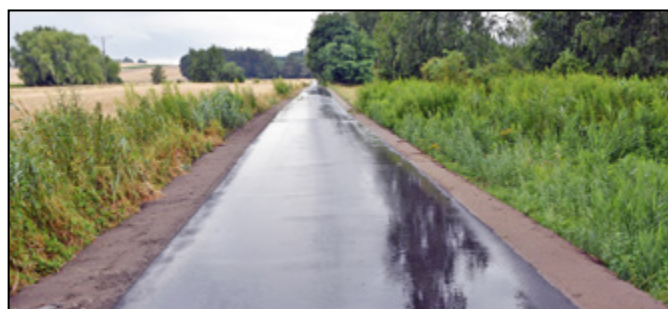
Opatowiec – Plebańska