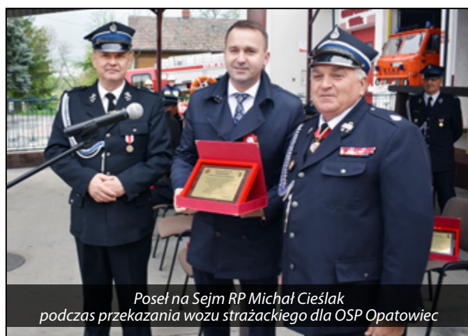
Poseł na Sejm RP Michał Cieślak podczas przekazania wozu strażackiego dla OSP Opatowiec

isk przy naszych szkołach. Kwota ok. 60 tys. zł. z Funduszu Sprawiedliwości, będącego w dyspozycji Ministra Sprawiedliwości, dała niemal stu procentowe zabezpieczenie na zakup specjalistycznych ubrań strażackich dla trzech jednostek OSP. Wsparcie łączne, jakie otrzymaliśmy nasi strażacy ochotnicy, ze środków MSWiA i WFOŚiGW, przy znikomym wkładzie własnym, wyniosło niemal 100 tys. zł. Dodajmy jeszcze, że w tym roku miało miejsce przekazanie lekkiego samochodu bojowego dla OSP Opatowiec, z dyspozycji środków Budżetu Państwa, Funduszy Ochrony Środowiska i własnych.