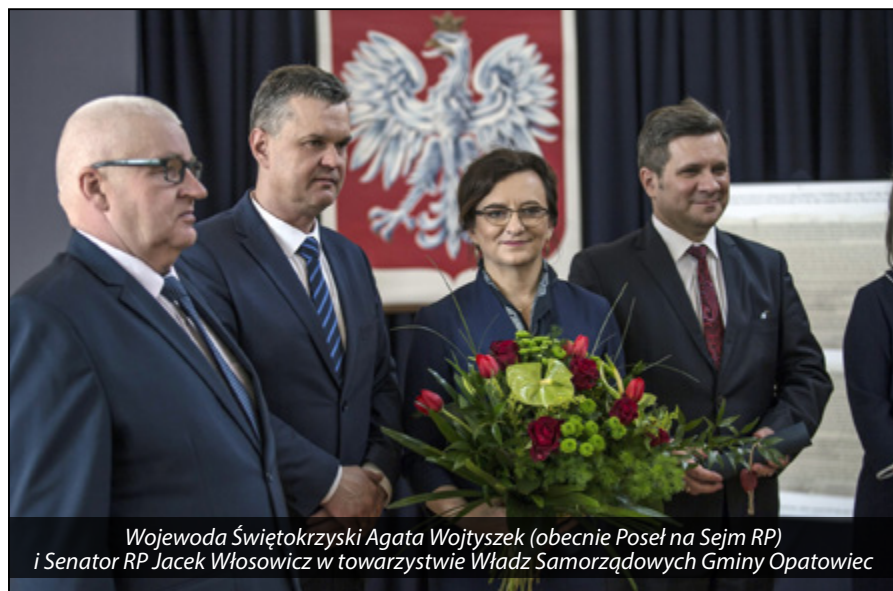
Wojewoda Świętokrzyski Agata Wojtyszek (obecnie Poseł na Sejm RP) i Senator RP Jacek Włosowicz w towarzystwie Władz Samorządowych Gminy Opatowiec

inwestycja, realizowana w porozumieniu z zainteresowanymi mieszkańcami. Wszelkie formy wsparcia zadania, zarówno ze środków europejskich jak i krajowych, czynią je ekonomicznie łatwiejszymi. To zawsze kilkadziesiąt procent taniej przy każdej inwestycji.