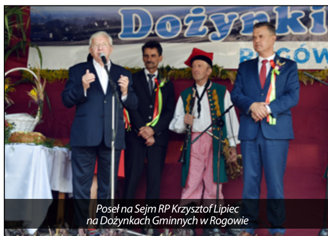
Poseł na Sejm RP Krzysztof Lipiec na Dożynkach Gminnych w Rogowie

Więc znów, parę danych. Z miliona złotych, wydatkowanego na budownictwo drogowe, aż dwie trzecie, to środki pozyskane. Kolejne, ponad 200 tys. zł, to wkład Urzędu Marszałkowskiego w realizowaną już, inwestycję ścieżki rowerowej w Kamiennej. Dzięki życzliwości i zrozumieniu ze strony Zarządu Województwa Świętokrzyskiego, gmina otrzymała na Rewitalizację Opatowca, dodatkowo, niemal 700 tys. zł. Kolejne, ponad 370 tys. zł. z Ministerstwa Sportu, spowoduje blisko zerowy koszt budowy nowoczesnych bo-